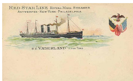
Het stoomschip Vaderland van de Red Star Line