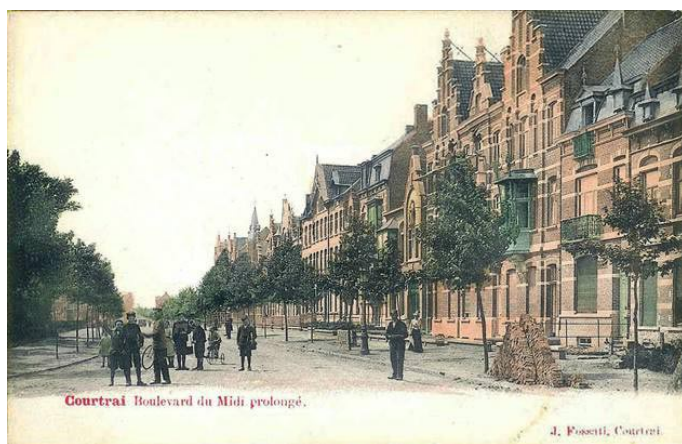
De Verlengde Zuidlaan, later omgedoopt tot Vanden Peereboomlaan