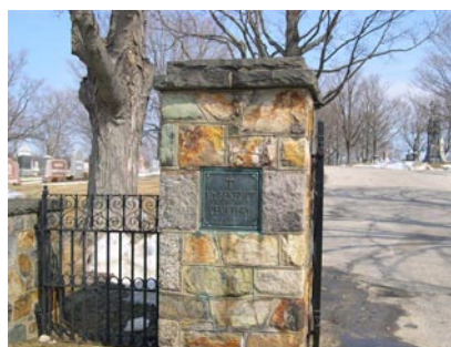
Mount Benedict Cemetery in West Roxbury, Suffolk Massachusetts waar Florence Carlu begraven lag.